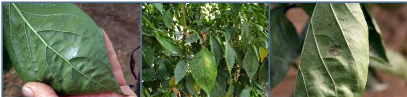
Blanc sur poivron